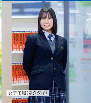
女子冬服(ネクタイ)