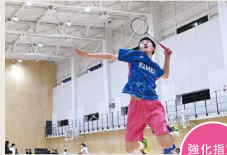
男子バドミントン部