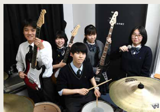
ロックバンド愛好会