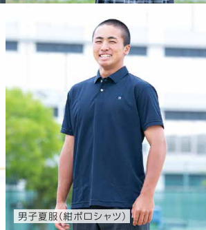
男子夏服(紺ポロシャツ)