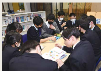
リベラルアーツ同好会