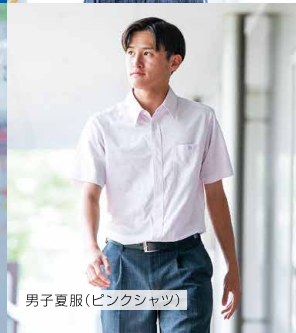
男子夏服(ピンクシャツ)