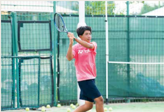
男子硬式テニス部