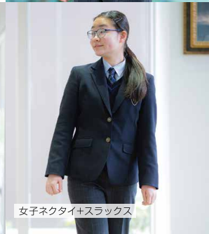
女子ネクタイ+スラックス