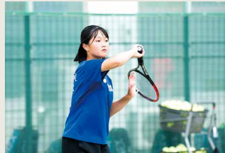
女子硬式テニス部