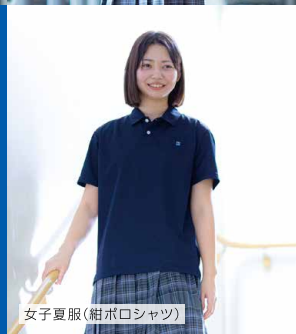
女子夏服(紺ポロシャツ)