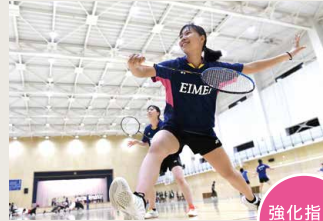
女子バドミントン部