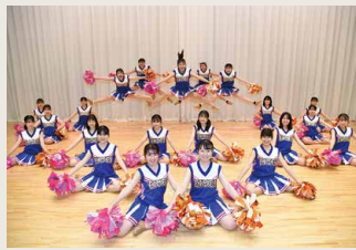
チアリーディング部