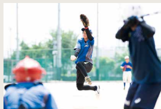
女子ソフトボール部