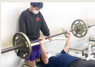
ウエイトトレーニング同好会