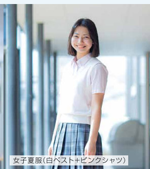
女子夏服(白ベスト+ピンクシャツ)