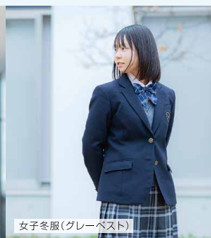
女子冬服(グレーベスト)